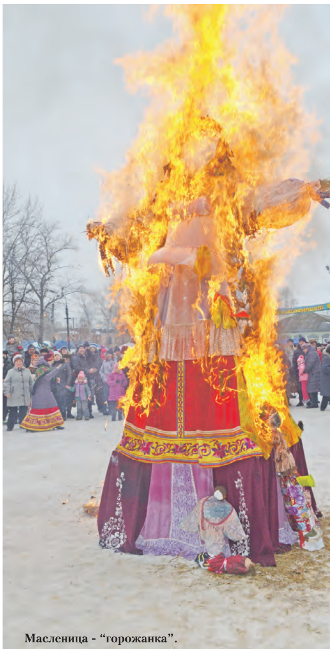
Масленица - "горожанка".