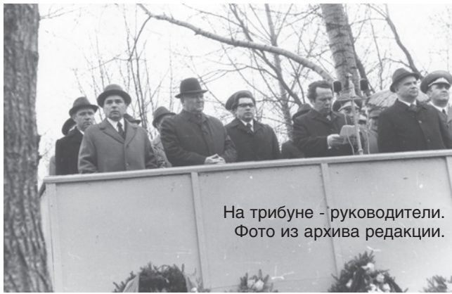
На трибуне - руководители.

Слава тем, кто громил врага на фронтах, кто сейчас охраняет мирный труд людей!